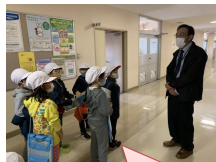
2年生 市民会館見学