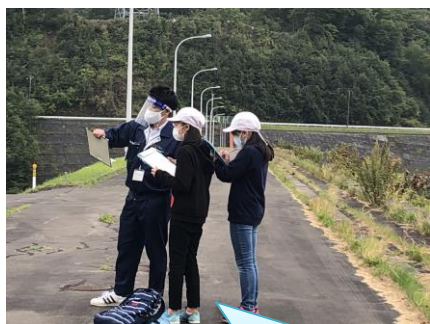
4年生 幌別ダム見学

地域の皆様に教えていただいている時の子供たちはとても生き生きとしています。今後ともご理解とご協力をお願いします。